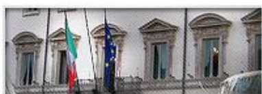
Roma – Presidenza del Consiglio

Fa sorridere con amarezza ricordare che, in un passo de “Il Gattopardo”, don Fabrizio di Salina, commentando le riforme ai tempi dell’Unità d’Italia, chiosa: «L’intenzione è buona, ma tardiva». [2] Evidentemente, in Italia, c’è sempre qualche intenzione apprezzabile, ma “tardiva”.