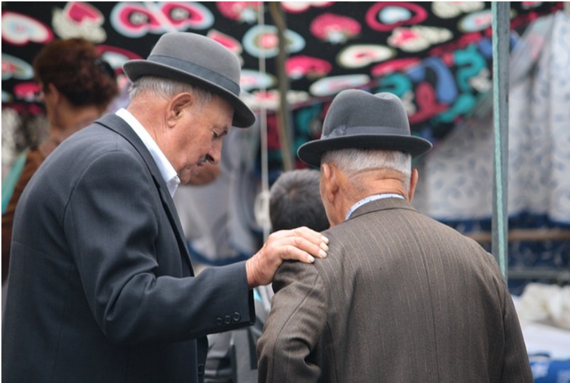
Immagine ex Pixabay

Scendendo al livello operativo dei nuovi Programmi di spesa che verranno attuati, su scala nazionale e su scala regionale, con le risorse del FSE Plus va ricordato che: