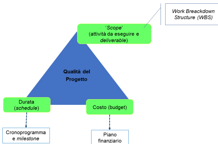
Figura 3 – Il “triple constraint” dei progetti

Arthur Penland Dempster , professore emerito di matematica e statistica alla Harvard University, enfatizzava appunto questi tre aspetti – attività da realizzare e deliverable del progetto realizzate secondo i requisiti richiesti da beneficiari e/o sponsor, costi e durata definita – quali elementi-cardine di un progetto efficace e di qualità, rappresentabili come lati di un triangolo.